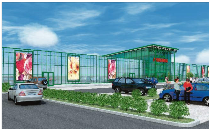
So großzügig werden Parkplatz- und Eingangsbereich des Gartencenters Arkenau die Kunden künftig begrüßen.

der Richtung aktiv geworden zu sein. Der Unternehmer hat sich mit seinem neuen Gartencenter dem Konzept der Bellandris-Gruppe innerhalb der Sagaflor angeschlossen – „allein würde ich ein so großes Projekt niemals angehen“, ist Arkenau überzeugt. Er habe schon bei seiner ersten Kostenschätzung mit den Zahlen völlig daneben gelegen und sei jetzt nur froh, solche erfahrenen Experten wie denen der Bellandris-Gruppe vertrauen zu können. „Dort stehen Ihnen jederzeit Ansprechpartner zur Verfügung, auch die Glaubwürdigkeit gegenüber den Banken ist eine völlig andere“, sind seine Erfahrungen. „Angesichts solcher großen Zahlen habe ich manchmal selbst schon ein etwas mulmiges Gefühl im Bauch“, lächelt Arkenau. Sicher verständlich – bei einer Investitionssumme von rund fünf Millionen Euro. (kla)