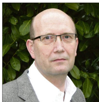
Architekt Udo Scheffler.

„Beim Bau eines Gartencenters besonders brisant sind die Punkte Brandschutz, Parkplätze, Sortiment, Baukosten, Wegeführung und Einrichtung.“