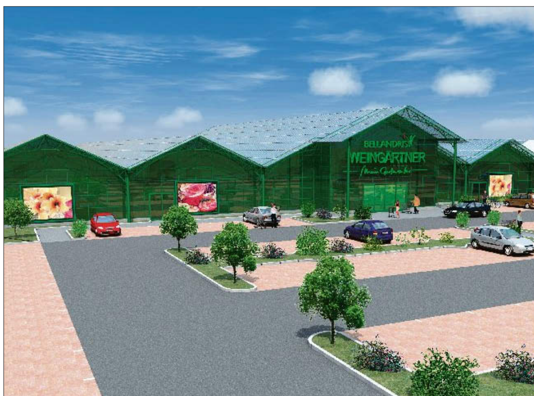
CAD-Animation: Der Pflanzenhof Weingärtner (Lilienthal) entstand auf rund 20.000 Quadratmetern Grundstück.

Eine der besonders großen Hürden für einen Neubau liegt darin, die richtige Fläche zu finden.